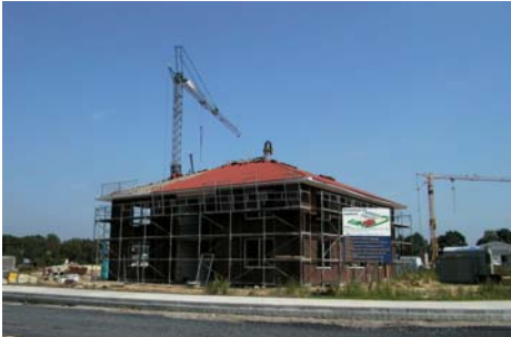
9028 Neubau Bürogebäude und Lagerhalle