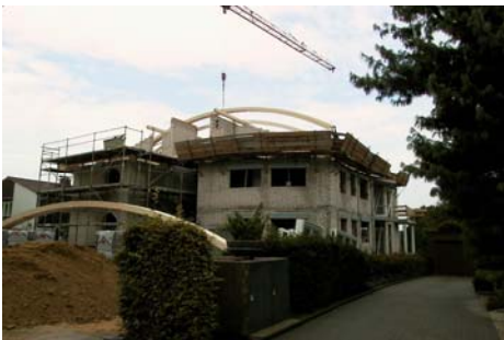
9031 Neubau MFH Aasee