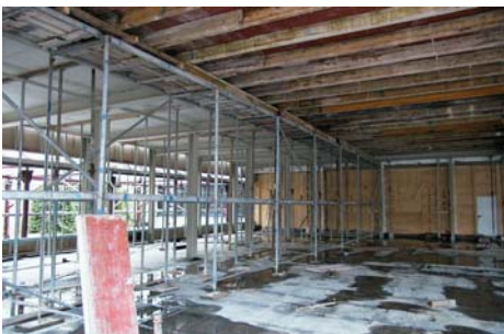
9033 Erweiterung/Umbau Sparkasse Gronau