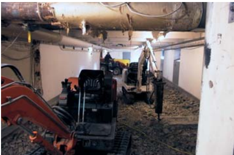
9032 Umbau/Sanierung alte Uni-Bibliothek