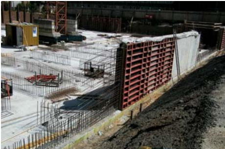
9030 Neubau Turnhalle Adolph-Kolping-Schule