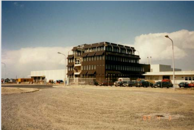
Fischkonservenfabrik Richter + Greif

Bauherr: Richter und Greif Leistungen: Planung; Produkttechnologie; Tragwerksplanung; Bauleitung; Abrechnung, Abnahme Kosten: rd. 16 mio €